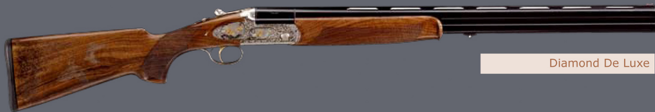
Diamond De Luxe